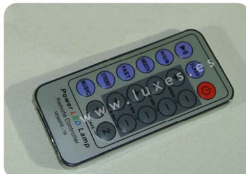
Mando a distancia Ref: 1016010000