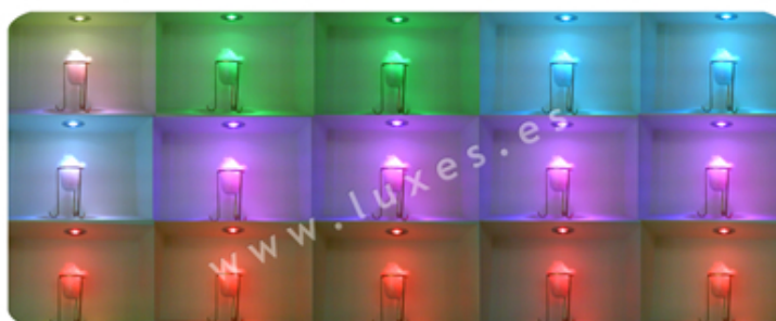
Mosaico de fotos del mismo arreglo iluminado por una bombilla RGB en secuencia de cambio de colores