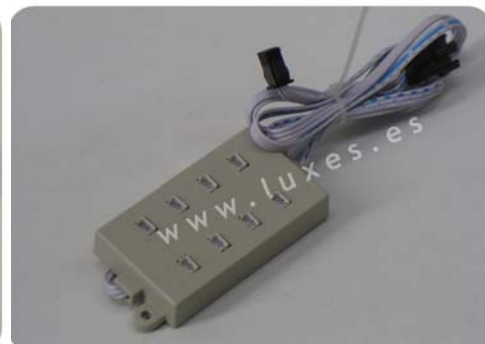
Caja derivadora Ref: 1016040000