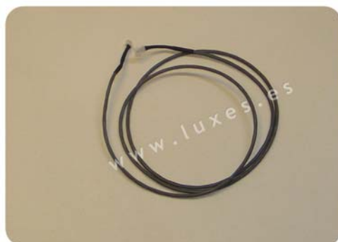
Extensión cable 1 mt Ref: 1016050000