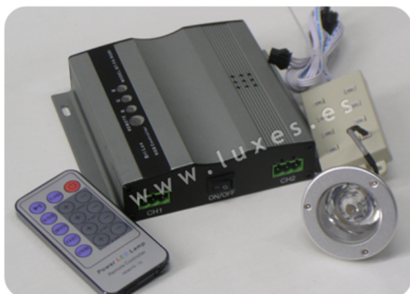
Controlador RGB - Ref: 1016030000